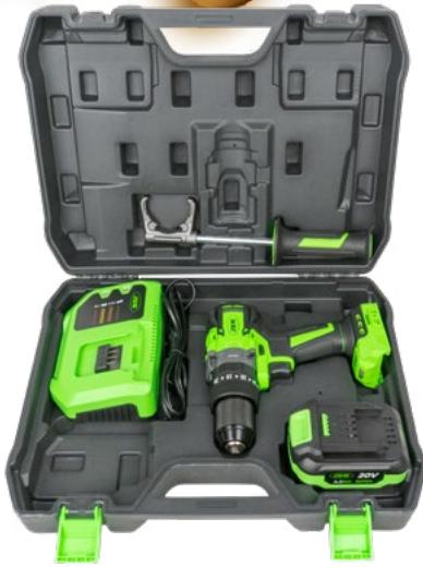
60047C 318,00€ PDV MASINA DE GAURIT CU PERCUTIE 2 VITEZE , CU BATERIE SI VALIZA