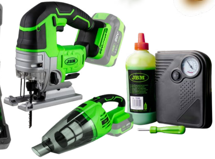
60001 88,00€ PDV ASPIRATOR PORTABIL