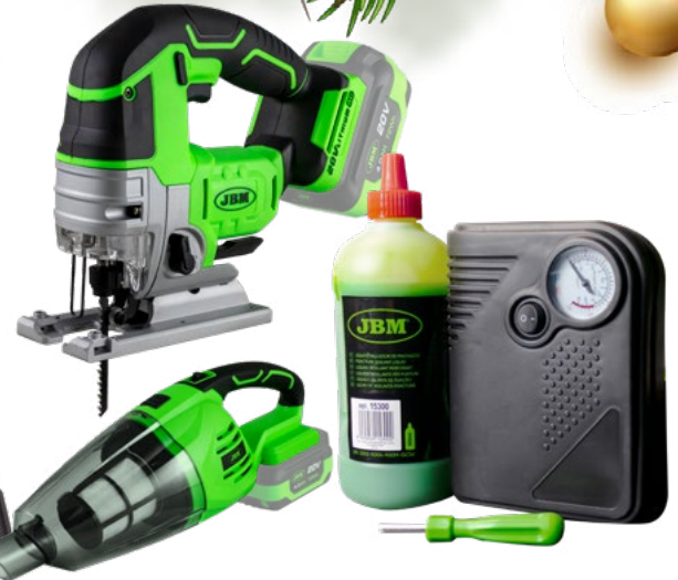
60001 88,00€ PDV ASPIRATOR PORTABIL